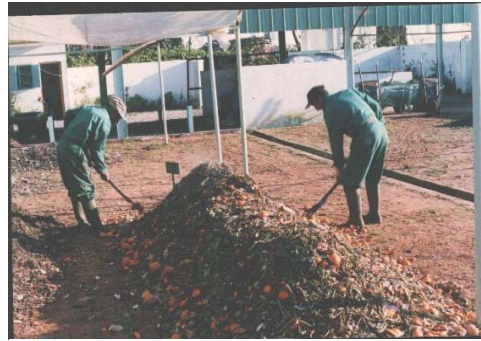
Retournement manuel des andains dans l'Unité de Tri et de Compostage expérimentale de Salé Bab Lamrissa

A ces aspects techniques relatifs au mode de valorisation des déchets ménagers, une réflexion et des actions ont été engagées pour envisager dans quelles mesures il serait souhaitable de développer le tri à la source pour renforcer l'efficacité globale du procédé. Un processus de concertation associant les associations locales, la population et la commune a permis de mettre en route un système expérimental de tri binaire des déchets (organique, non-organique) assuré par les populations du quartier pilote.